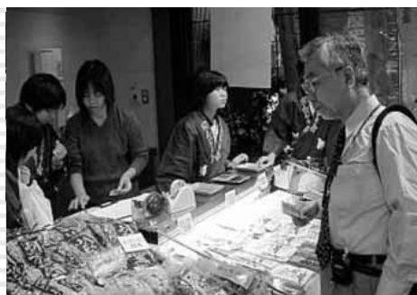
にほんばし島根館にて

また、2年に1度行われる修学旅行では、隠岐の観光PRを行なっています。事前学習として地域の方にしげさ節の皿踊りや手踊り、銭太鼓を教わったり、久見や中村の加工場では、そばかりんやいかすみせんべい、あごだしを作る体験をさせていただきました。観光PRではその体験をいかし、踊りを上手に披露したり、商品の説明を詳しくしたりすることができました。