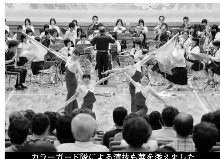
カラーガード隊による演技も華を添えました