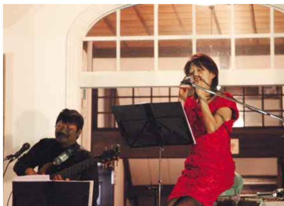
音楽とトークで秋のひとつきを満喫

美しくライトアップされた隠岐郷土館の前に集まった約200人の観客が、フルートとオカリナの繊細で優しい音色を楽しみました。