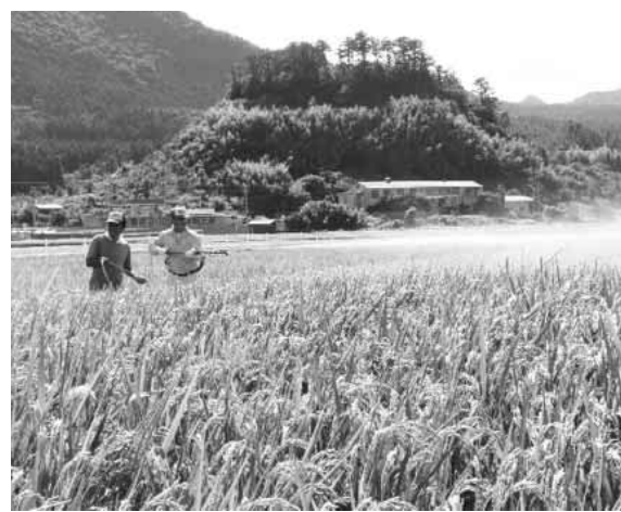
うすめた「藻塩」を散布しています

「ハデ干し米」と並び「隠岐のこだわり米・ブランド米」として考案され、栽培・販売されている「隠岐の藻塩米」。「藻塩米（もしおまい）」は、稲の生育期に海藻と海水から製造された「藻塩」をうすめたものを散布して栽培したお米です。 「米産地として生き残っていくには何が必要か？」をテーマに、JA隠岐を中心として島根県、隠岐の島町などで構成する「隠岐こだわり米推進会議」の取り組みで、地域の特色を生かしたこだわり米を提案しました。産地間競争に勝てるような特色ある米作りの目玉として、平成15年から試験的に栽培を開始、平成16年から徐々に栽培面積を拡大して今日に至っています。 平成16年には3haで9トン弱を出荷。主要な出荷先である愛知県では試食販売も実施して好評を得るとともに、課題も見えてきました。翌17年には、前年の生産結果・課題をもとに栽培方法の改良などを行い、生産を拡大してきました。 今年、更なる普及を図るため小中学生の意見も聞こうと、10月6日