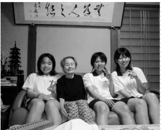
お年寄りと一緒に

地域の人との交流も多く、その主な行事として独居老人宅訪問があります。中村地区で1人で暮らしておられるお年寄りのお宅へ訪問して、普段できない所の掃除を手伝ったり、お話をしたりして交流を深めています。この行事は昨年からはまりましたが、中村中学校の重要な行事の一つになっています。