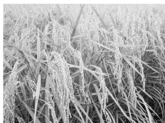
こうべをたれる「隠岐の藻塩米」