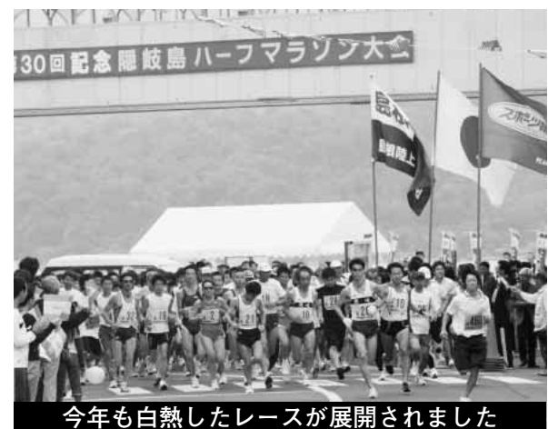
今年も白熱したレースが展開されました