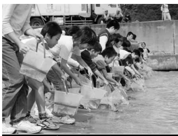
マダイの稚魚を一斉に放流

隠岐の島町とJFしまね西郷支所で組織されている島根県水産振興協会・隠岐島後地域栽培漁業部会では、水産資源の増大をはかるためマダイの稚魚の放流を行っています。今回は10月3日(火)中村海水浴場で中村保育所の園児と中村小学校の児童が放流を行いました。放流の前に隠岐支庁水産局の水産普及員の方が、隠岐の漁業や栽培漁業についてイラスト入りの冊子やクイズなどを交えて説明した後、子供たちは海岸に並び、バケツに入った稚魚を放流しました。いつも食べている魚が食卓に並ぶま