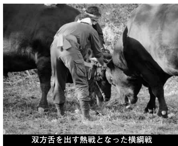
双方舌を出す熱戦となった横綱戦

すばらしい秋晴れとなった10月13日(金)、一夜嶽牛突場で今年の隠岐牛突き本場所を締めくくる、一夜嶽牛突大会が行なわれました。今年は7番(引き分け4番、勝負3番)が行われ、どれも白熱した取組が繰り広げられました。特に横綱戦は、双方が舌を出しながらの30分に及ぶ熱戦となり、会場も大いに盛り上がりま