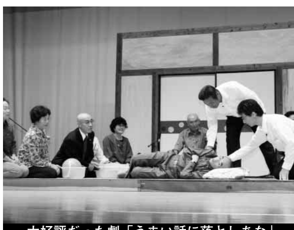
大好評だった劇「うまい話に落としあな」

全国的に飲酒運転等の危険運転が問題となる中、9月15日（金）には「音の安全パトロール」、9月16日（土）には交通安全大会が行なわれました。 「音の安全パトロール」は、島根県警察音楽隊によるコンサートと交通安全や犯罪被害防止に関するお話を通じて、楽しみながら防犯意識を高めてもらうというイベントです。この日は西郷中学校と隠岐高校の吹奏楽部も出演し、合同演奏などを行ないメッセージを伝えました。