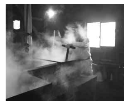
大きな釜で海水、海藻を煮詰めていきます

●藻塩に関するお問い合わせ先 隠岐の島町役場 五箇支所 地域振興課 TEL: (08512) 5-2211